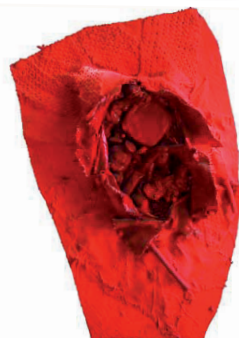
Vaginale Ausbrüche, 2003