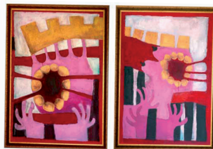
Ödipus REX/ Ödipus und Lokaste, 2007

Denn noch bevor das Konzept überhaupt verwirklicht – und damit beurteilbar – ist, wird es vom allgegenwärtigen Medienboulevard schon mit Häme überschüttet und skandalisiert. Fast seine gesamte Seite der Krone des österreichischen Journalismus widmet da Gerhard Felbinger dem Projekt, um es vorneweg gleich einmal als „verrückt“ zu titulieren – klar, etwas Anderes kann die Auseinandersetzung