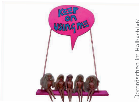
Dornröschen im Halbschlaf/ Keep on using me, 2001

auf den Antrag auf Kulturförderung bezieht – und sich dafür aus dem untersten Schub „lad'!“ bedient. Von „Steuergeldern reinschieben“ ist da die Rede, bei gleichzeitigem „Gürtel enger schnallen“ – zu anderen Assoziationen als jenen unter der Gürtellinie ist (dieser) Mann wohl nicht fähig. An Verleumdung hingegen grenzt die Bezeichnung als „dubioses Projekt“, von intellektueller Schwäche zeugt schon eher der Vorwurf, die Homepage würde noch nicht existieren – logischerweise, handelt es sich doch um